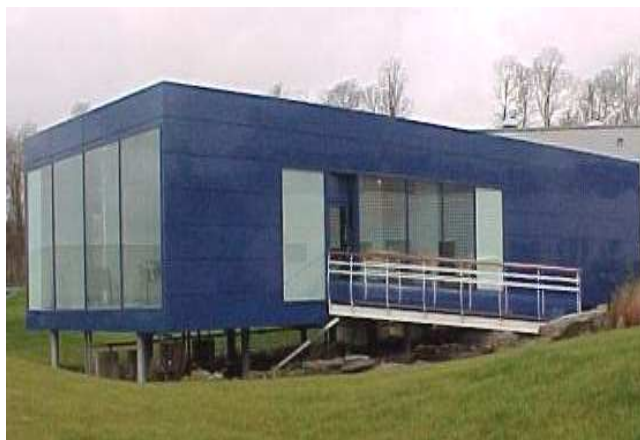
Projet Le BARON- Réalisation Lycée Yves Thépot Quimper