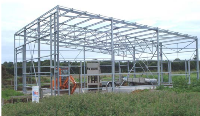
Réalisation Lycée Yves Thépot Quimper